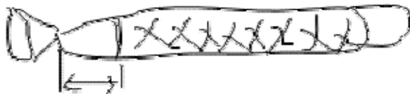
5 - 6 cm空けて結ぶ

先ほどもいいましたが、砂利をいれたバッグを横に寝かせておいて置くと、結束バンドで結んでいく作業が大変になります。ですから、立てかけておいたほうが作業しやすいと思います。